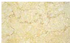
Pietra Gialla anticata