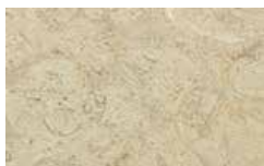
Perlato Svevo anticato